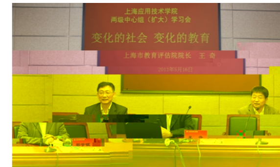
上海市教育评估院院长王奇

！” # $ % & 月 16 日下午，学校召开两级中心组(扩大)学习会，上海市教育评估院院长王奇应邀来到我校做“变化的社会、变化的教育”专题报告。校党委书记祁学银主持报告会。校党委副书记宋敏娟，副校长陈东辉、叶银忠出席。校全体中层干部、党支部书记、工会主席、马克思主义教学部全体教师、教务处全体成员、规划与学科建设办公室全体成员、部分辅导员级中心组组成 王奇“变化的社会 变化的教育”、“化、科思 建立科学的、符的办学，希望大干部教师够一步解王奇院长报告中述的教育，转化到自的工学习之中。 王奇报告中出我处主导的教育题，教育规划建教育心，教育建办学，教育的心学习，的学来，学应思的，的，的成长，告大成的，的，我的