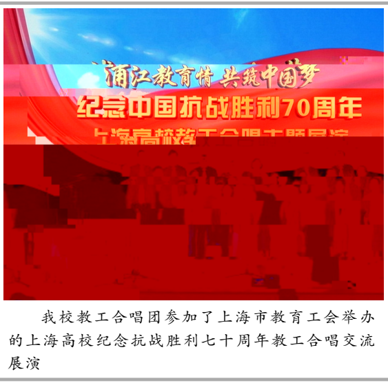
我校教工合唱团参加了上海市教育工会举办的上海高校纪念抗战胜利七十周年教工合唱交流展演

(通讯员 饶婷) 6 1 上 海 应 技 悦 > 牵 圆 ] 赠 ' ( 在 贵 州 黔 南 州 天 县 盆 小 ' ( 盆 小 上 盆 小 师 感 悦 牵 志 者 们 的 爱 心 与 付 得 天 县 台 黔 南 台 家 媒 体 的 者 跟 踪 道 悦 牵 益 l m 为 圆 为 " 的 线 上 和 线 宣 名 _ 150 余 筛 120 名 志 者 与 盆 小 120 名 小 朋 友 120 名 志 者 的 i 小 朋 友 们 实 : 儿 童 想 悦 牵 益 l m ^ N 100 余 件 体 器 赠 盆 小 ^ ^ 13000 F ^ - 230 件 悦 牵 益 l m 2014 与 盆 小 每 儿 童 会 圆 至 c 成 功 150 名 贫 儿 童 圆 们 t 为 v 小 立 u 籍 阅 览 悦 牵 的 志 者 们 为 3 > 的 尽 绵 i 同 + ) 大 于 爱 的 精 发 大