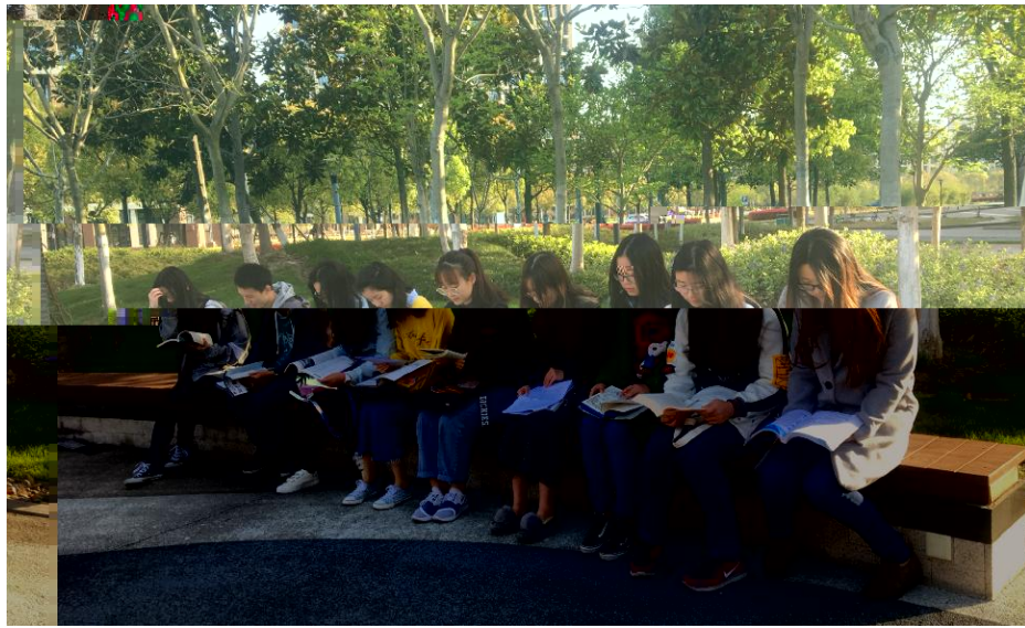
p q r s t u v w x y z | a b c d e f g h i j k l m n o