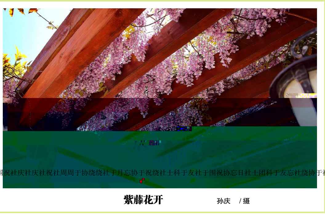
紫藤花开